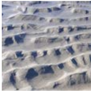
Balade du matin et du soir