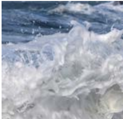
Grandes marées à la chapelle de la Joie