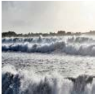
Un jour de grande marée