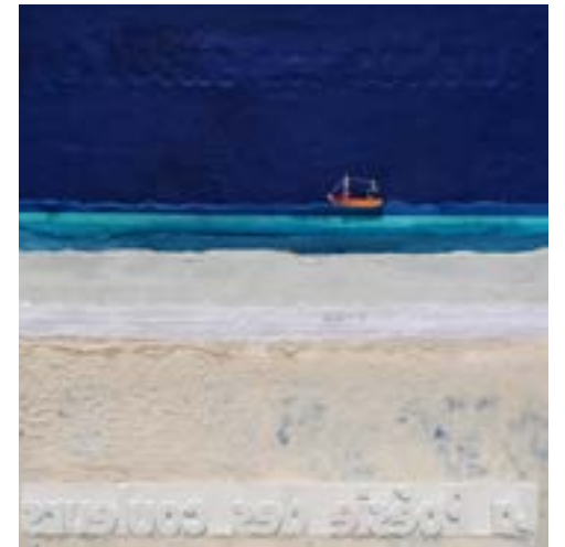
Vagues de papier déchiré